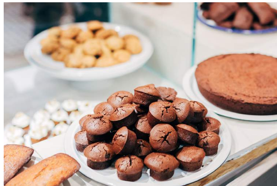
Bar à gâteaux