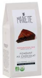
Préparations et Mini Préparations Marlette

Complétez votre pause gourmande en offrant un souvenir à vos collaborateurs !