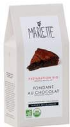
Préparations et Mini Préparations Marlette

Complétez votre pause gourmande en offrant un souvenir à vos collaborateurs !