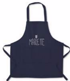
Tablier en coton bio Marlette