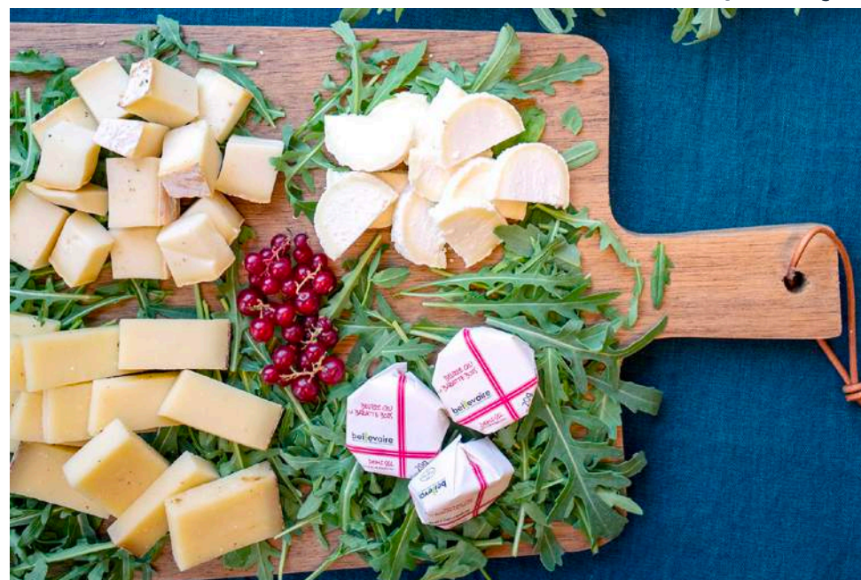
Buffet à partager