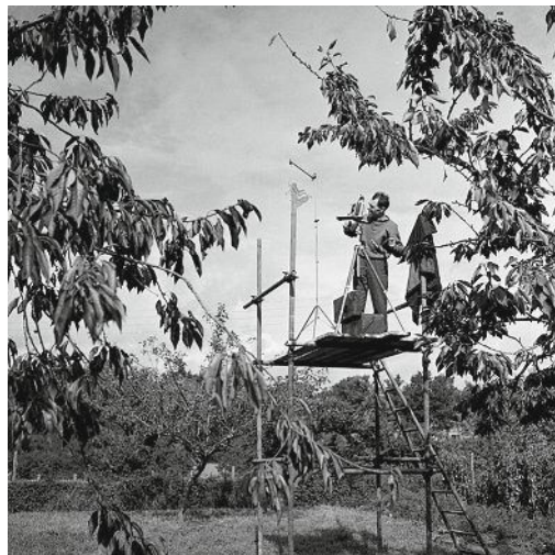
Robert Doisneau en prise de vues, septembre 1960.

Pensée par ses filles, Annette Doisneau et Francine Deroudille, la rétrospective «Instants donnés» rend justice à Robert Doisneau (1912-1994), trop souvent réduit à ses clichés les plus connus. Au fil de plus de 300 photos sélectionnées dans une collection qui en compte 450 000, on y découvre un Doisneau inattendu : des photos de mode, des portraits d'artistes – Picasso, Braque, et bien d'autres – saisis dans l'intimité de leur atelier, un reportage poignant sur les banlieues... et même quelques images en couleur ! Jusqu'au 12 octobre. museemaillol.com