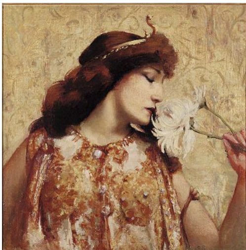
Georges-Antoine Rochegrosse, Sarah Bernhardt dans le rôle de Cléopâtre, après 1890.